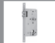
Schweres Kurbelfallen Einsteckschloss