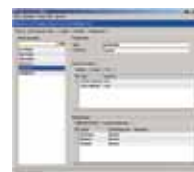
Access PC Admin Software